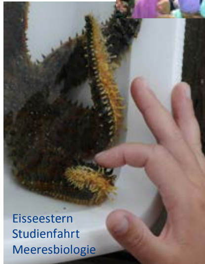
Eisseestern Studienfahrt Meeresbiologie