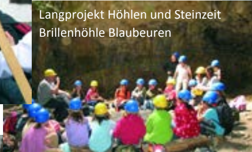
Langprojekt Höhlen und Steinzeit Brillenhöhle Blaubeuren