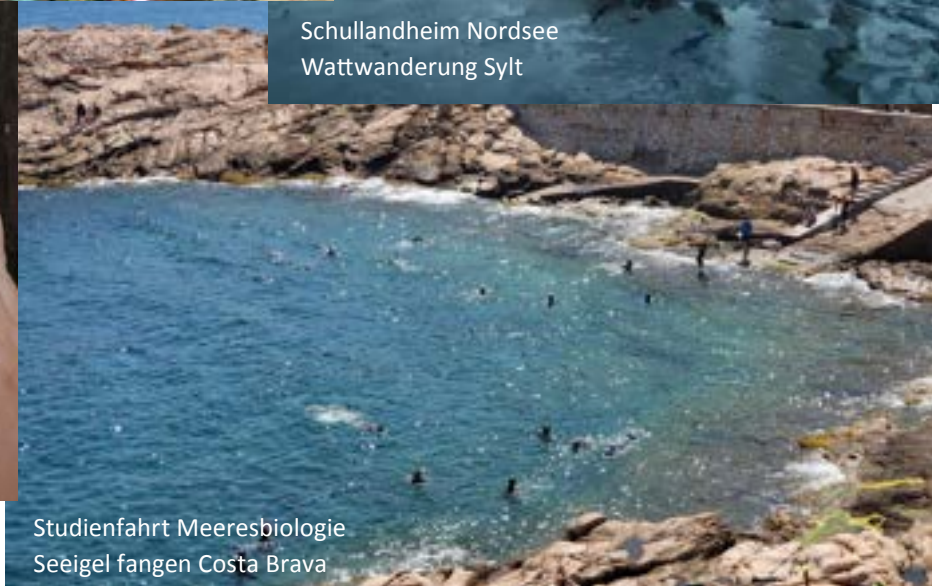
Studienfahrt Meeresbiologie Seeigel fangen Costa Brava