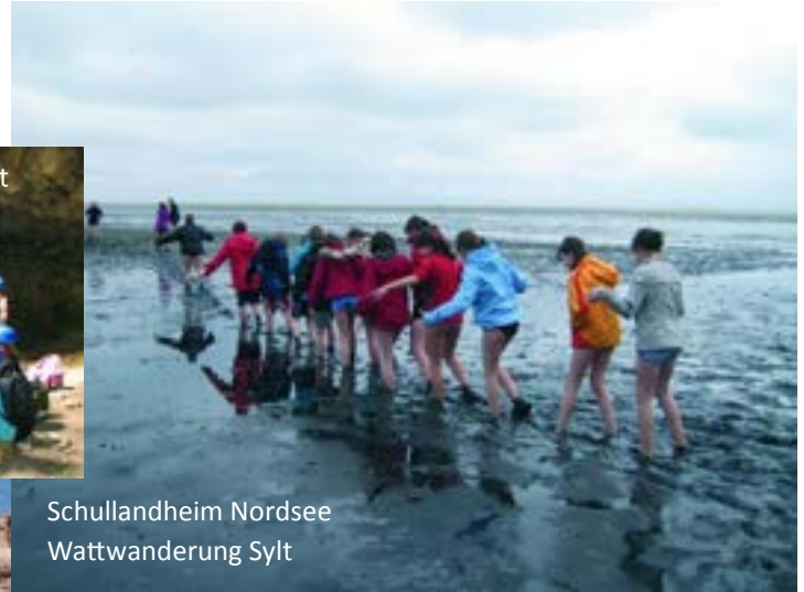
Schullandheim Nordsee Wattwanderung Sylt